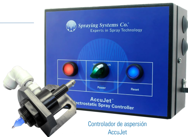
Controlador de aspersión AccuJet

La tecnología de aspersión electrostática tiene como base el principio científico de que "los opuestos se atraen". En la aspersión electrostática, un objetivo neutral conectado a tierra atrae a un líquido recubierto con carga negativa. La atracción física del líquido al objetivo arrastra el recubrimiento hacia la superficie de la cadena, lo que se traduce en eficiencias de transferencia típicas mayores al 90%. Se elimina el exceso de aplicación, la limpieza se reduce y el ambiente de trabajo mejora.